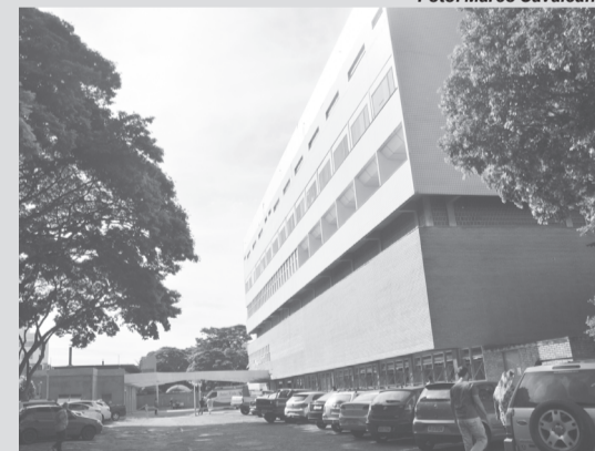
Medidas foram tomadas pelo Comitê de Enfrentamento à Covid-19 do HC/UFU