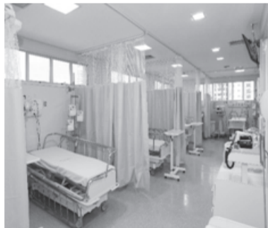
Sala de UTI