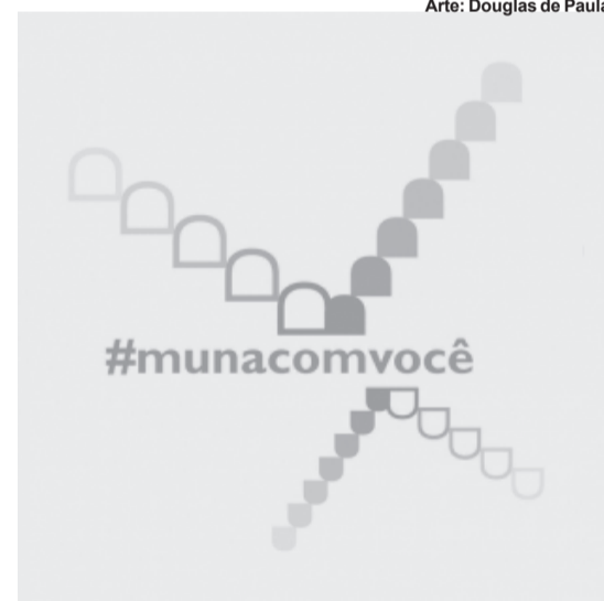
Programa MUnAComVocê acontece no perfil do museu no Instagram